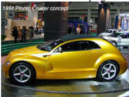
1998 Pronto Cruiser concept

För det första den höga bilen eller lilla MPV (Multi-purpose vehicle) ökar i popularitet i Europa. För det andra, i USA, Chrysler säljer många stora lastbilar och behövs för att tillverka en liten lastbil-liknande fordon för att uppfylla myndigheternas regler för bränsleekonomi. En Plymouth badged Pronto konceptbil visades för allmänheten år 1997. Det var en hög bil med många praktiska funktioner, en rymlig interiör och flexibla sittplatser. Bortsett från Plymouth Prowler stora grill, det var en modern design. Europeiska journalister tyckte om bilen, men de i Förenta staterna var mindre entusiastiska över sin styling.