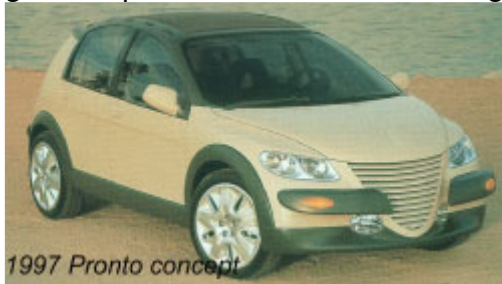
1997 Pronto concept

I mitten av 90-talet Chrysler Corporation hade lanserat Neon, en liten bil som var utformad för att tilltala både internationella och amerikanska marknaderna. Det beslutades att en långt, mångsidig bil, i likhet med Renault Megane Scenic, skulle göra en perfekt ställkamrat. Detta gjorde av två skäl.